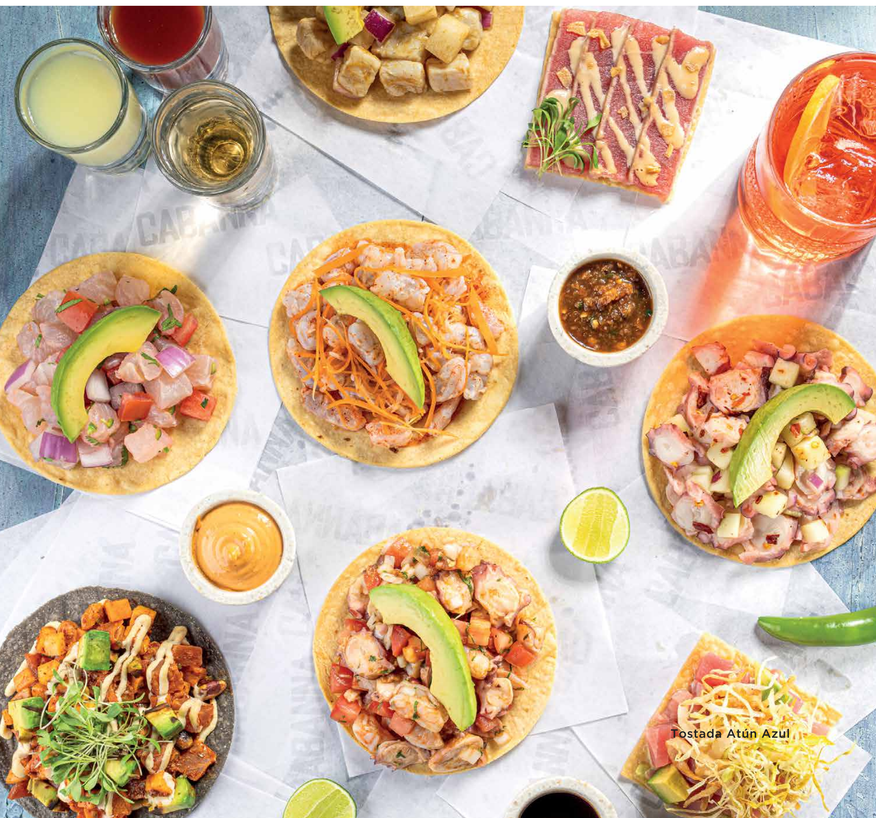
Tostada Atún Azul

Descubre el paraíso con la exclusividad de sabores al combinar atún fresco, pistache, aguacate tatemado aderezados con mayonesa de habanero. 60 g